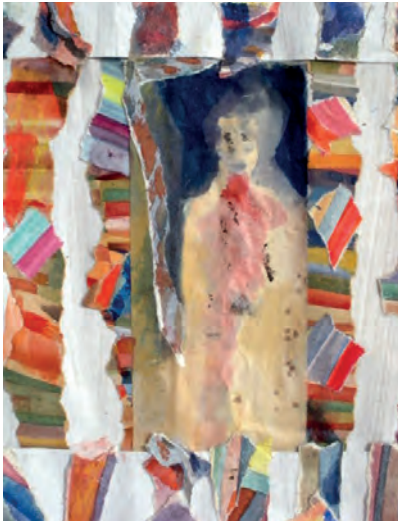
Aquarelle sur papiers découpés collés sur fond blanc (détail) 1994 à 2007

“Chez Yvonne Cattier, une peintre qui a l’air de couleur de source, née de l’inconscient. On l’assimilerait volontiers à quelque non pas ‘écriture’ mais peinture automatique, à l’instar des exercices chers aux surréalistes. Mais à y regarder de plus près il y a là quelques constantes, une vision personnelle, un monde qui semble à la fois de terre et d’eau. Cela peut aussi se développer en un long rouleau de papier, déroulant non pas une histoire mais un climat : terre indéfinie où l’on distingue quelques silhouettes, quelques architectures dans la pluie et le vent. Pourquoi cela m’évoque-t-il certain fond basculé sous le ciel bas de Jérôme Bosch.”