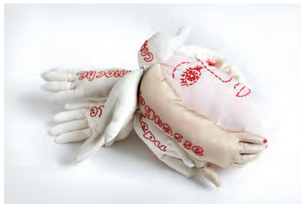
Brushing / 2017 Textile rembourré et brodé