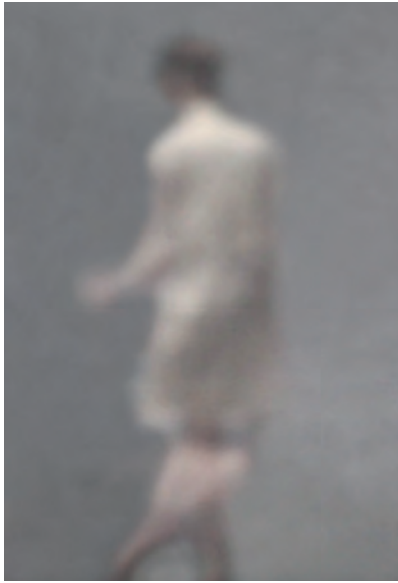
Figur beige in beige I. / 2012. New York Camera Obscura. Pigmentdruck auf Alu-Dibond, 150 x 100 cm. Auflage 3+1