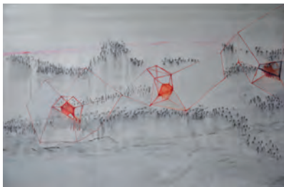
Série "Human Landscapes" HL7 / 100 x 150 cm / Acrylique, pigments et graphite sur papier