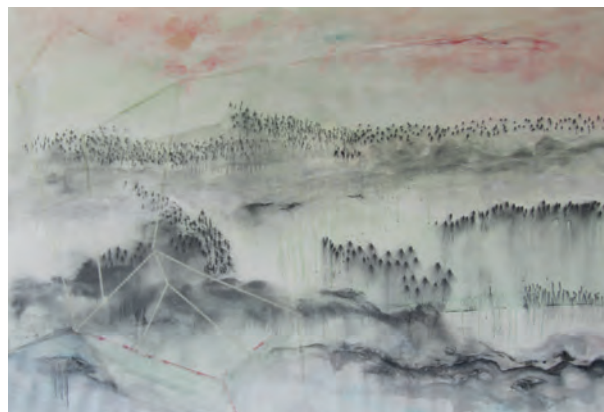
Série "Human Landscapes" HL1 - 100 x 150 cm Acrylique, pigments et graphite sur papier