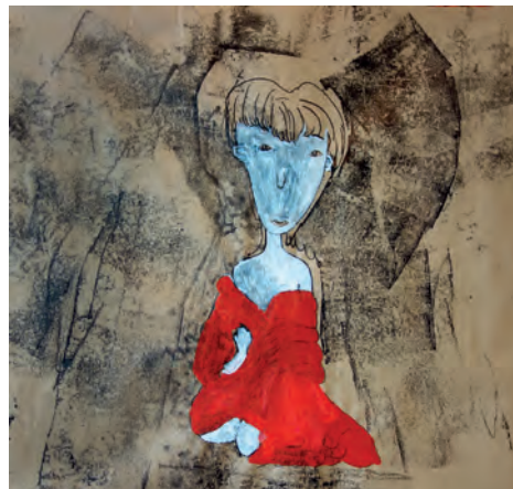
Gaëtan Eugène / 2016 Monotype encre et acrylique 95 x 95 cm