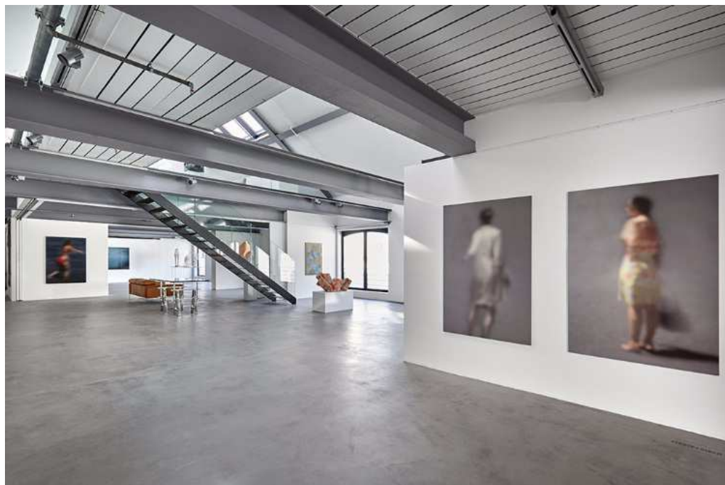
Vue de l'expo Résilience chez Esther Verhaeghe Art Concepts au Hangar H18