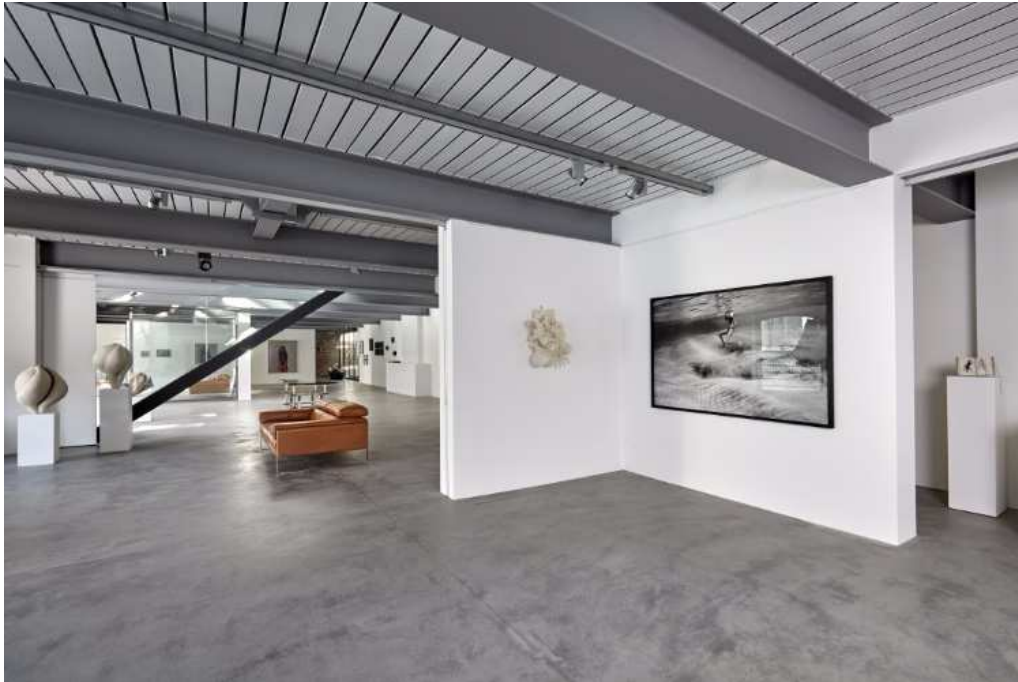
Vue de l'expo Résilience chez Esther Verhaeghe Art Concepts au Hangar H18