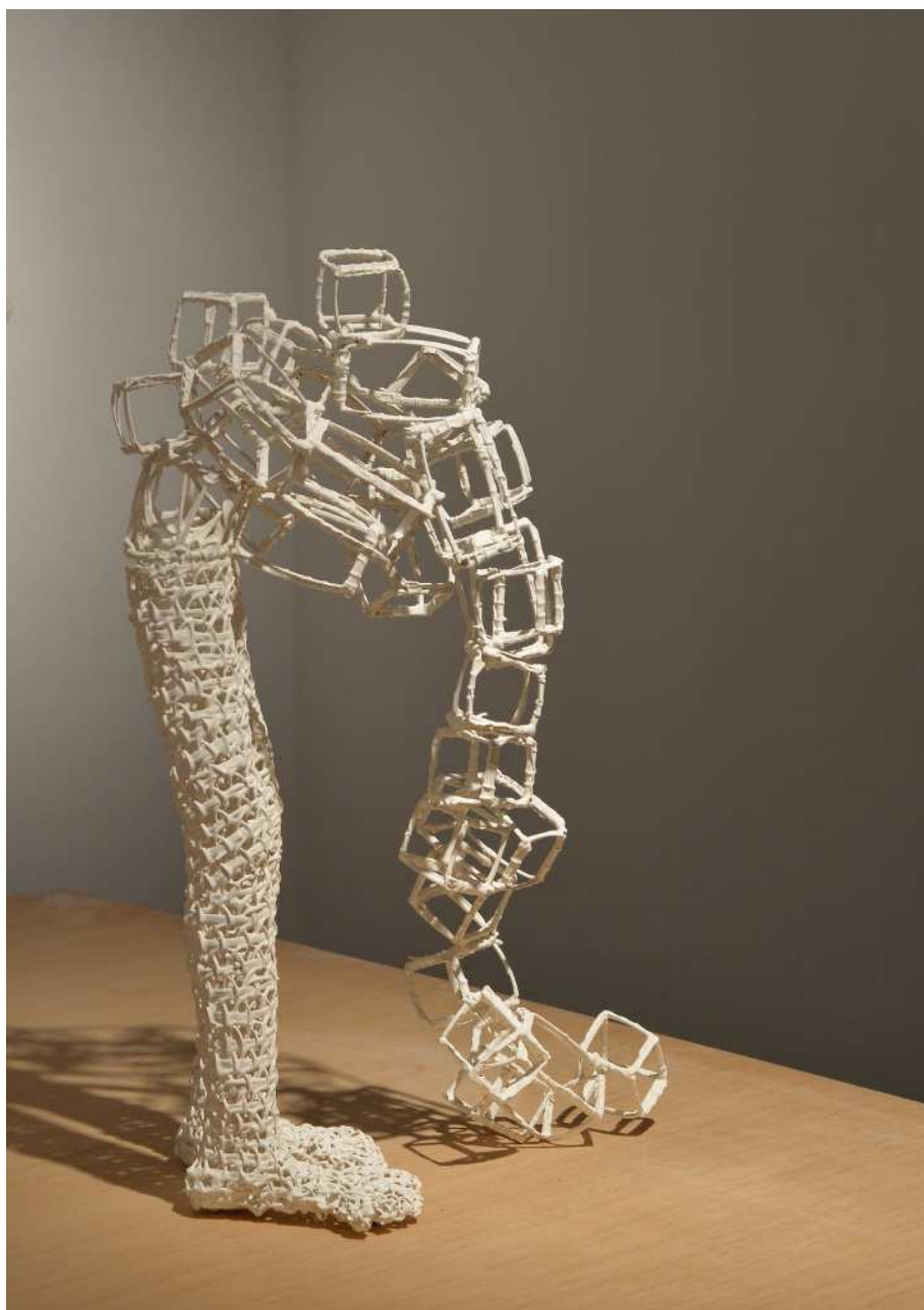
Stéphanie Jacques, Ce qu'il en reste VI, 2016, Esther Verhaeghe Art Concepts au Hangar H18

1050 Bruxelles Jusqu'au 26 mars Du mardi au samedi de 14h à 18h www.esthverhaeghe.com